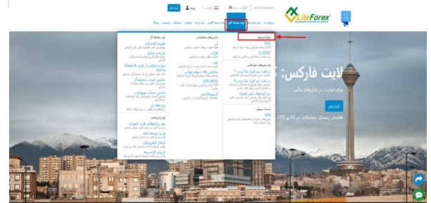
Forex بزرگترین بازار نقد در راستای تجارت ارزها

پس از تغییر زبان سایت از انگلیسی به فارسی، برای مشاهده انواع حساب‌های معاملاتی کارگزاری لایت فارکس بر روی دسته بندی معامله گران سپس انواع حساب‌ها کلیک کنید